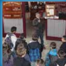
La jornada deths sau 280 participants en 2013