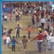
Mainats en canta 2000 participants en 2013