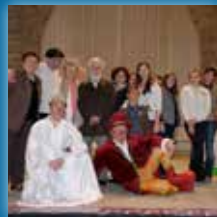
Le Concours Bigourdan d'Expression Gasconne 922 participants en 2013